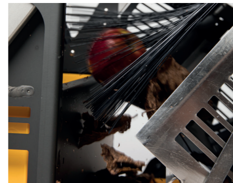
Die Laubbürste zum Abscheiden von Laub.

Die flexiblen Kunststofflamellen bilden gemeinsam mit dem Übergaberost das Herzstück der Obstraupe. Sie passen sich an unterschiedliche Obstgrößen und Bodenverhältnisse an und sorgen für die effiziente und schonende Obstaufnahme. Früchte werden durch die Lamellen der rotierenden Walze aus der Wiese gestreift und über den gefederter Übergaberost in die Obstkiste geschubst.